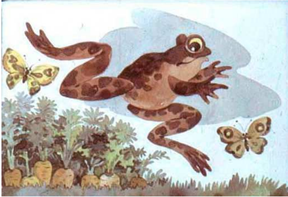
דלגה מעל ערוגת הגזר.