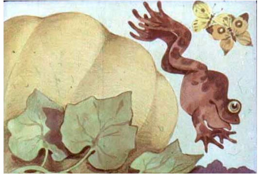
קפצה מעל הדלעת הגדולה.