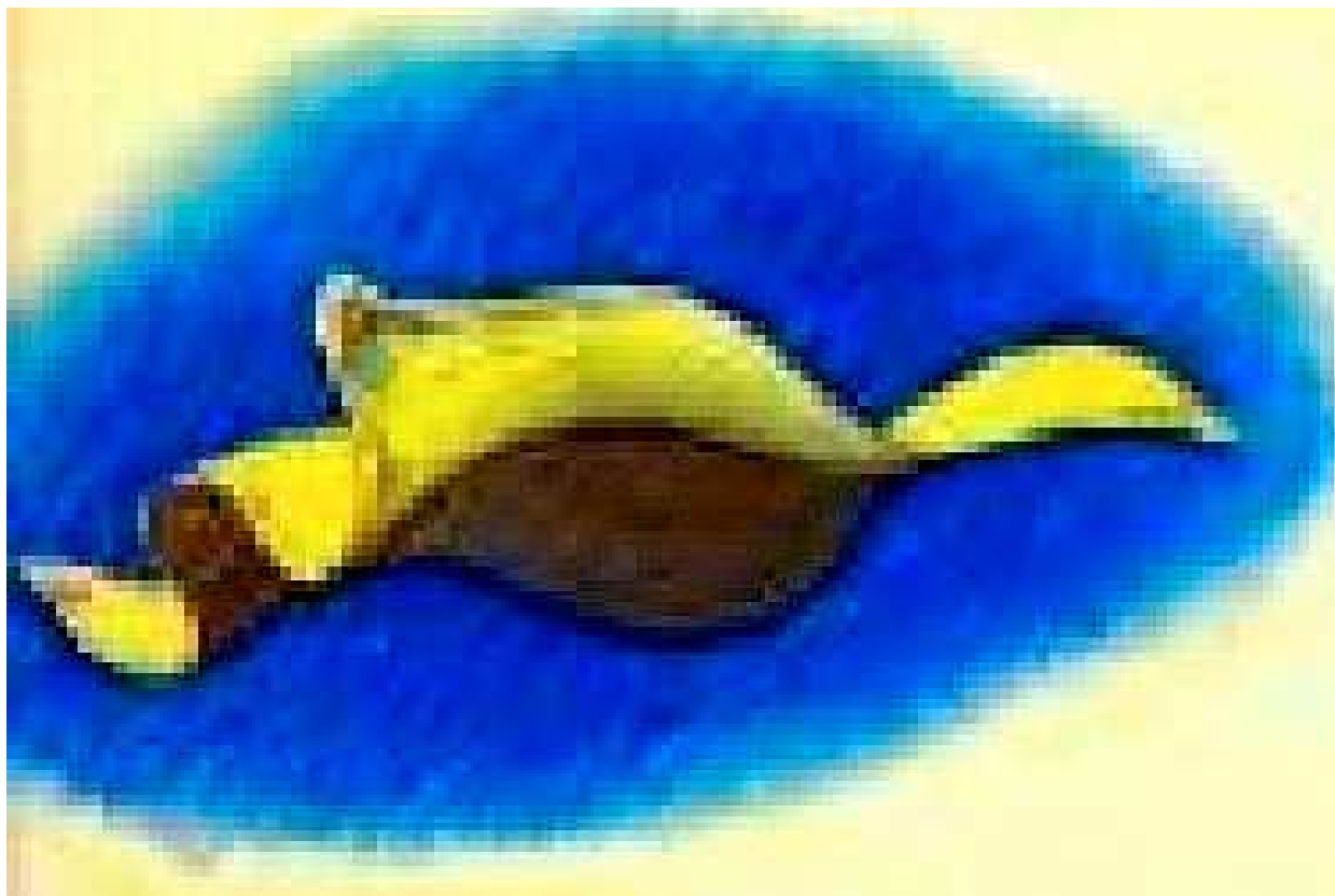
פ. חולינוי ציורים ט. בולפ