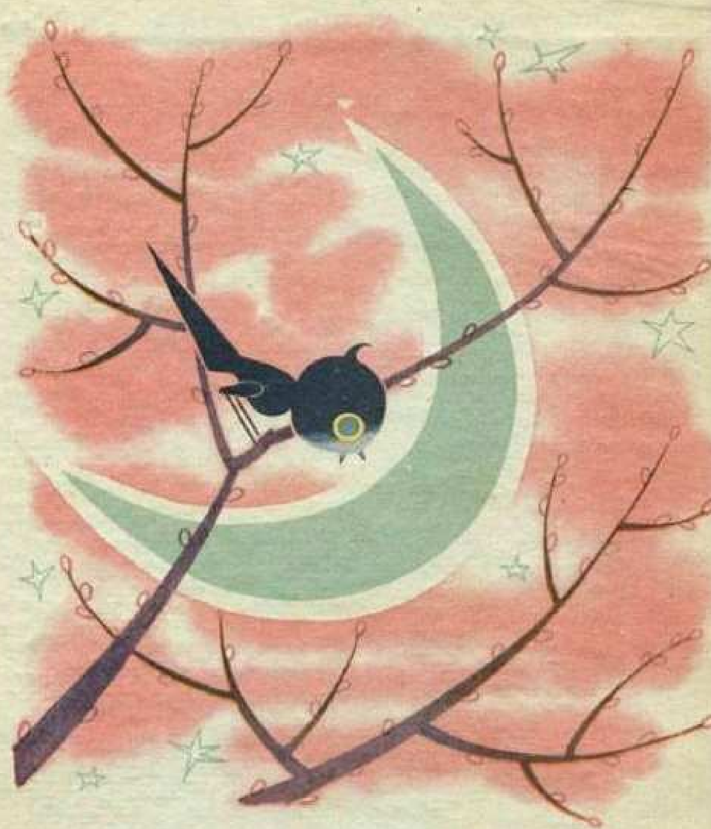
ציפור חשבה רגע ואמרה בקול דקיק: "הירח דומה לקערית ירוקה."