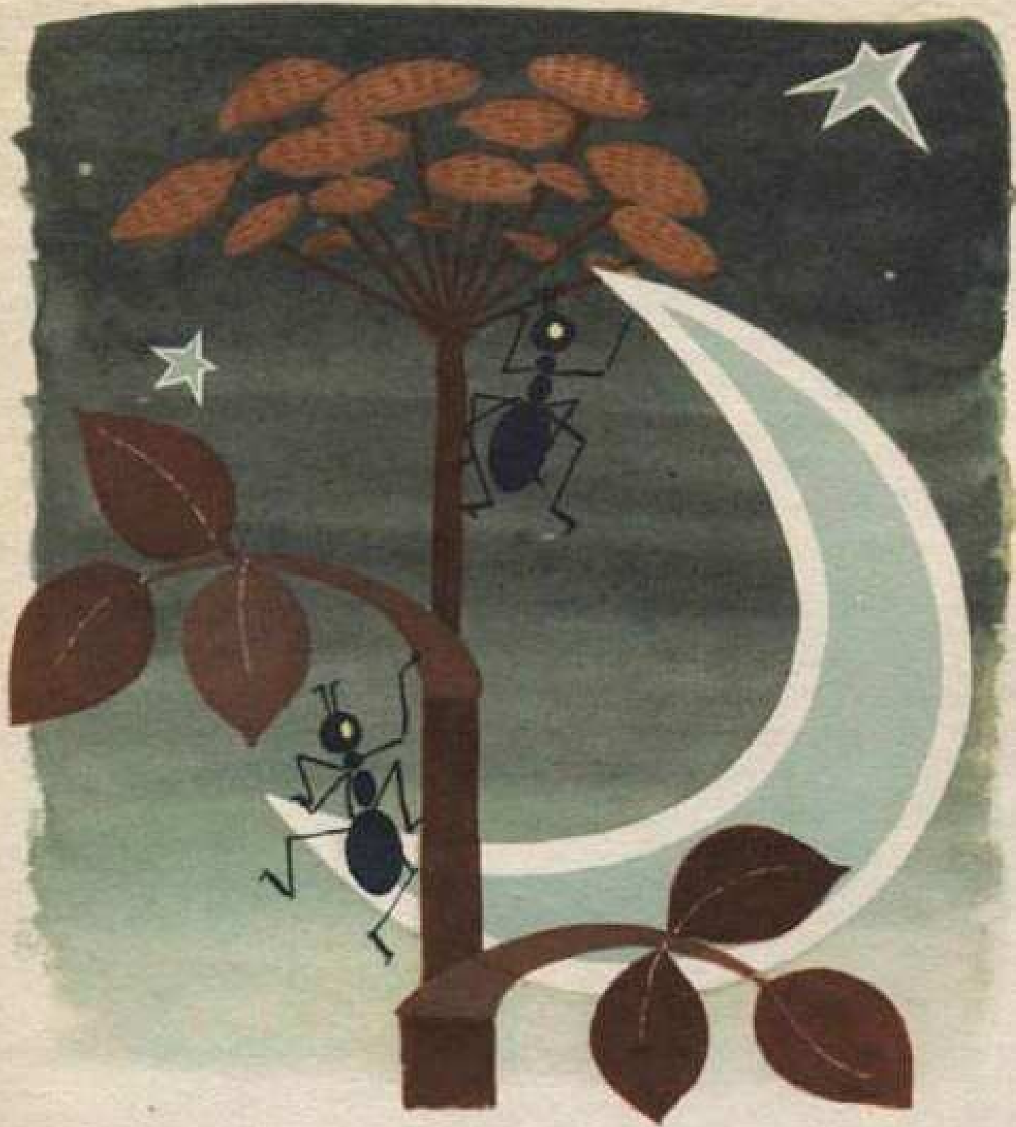
חשבו הנמלים "הירח הירוק דומה לנדנדה ירוקה."