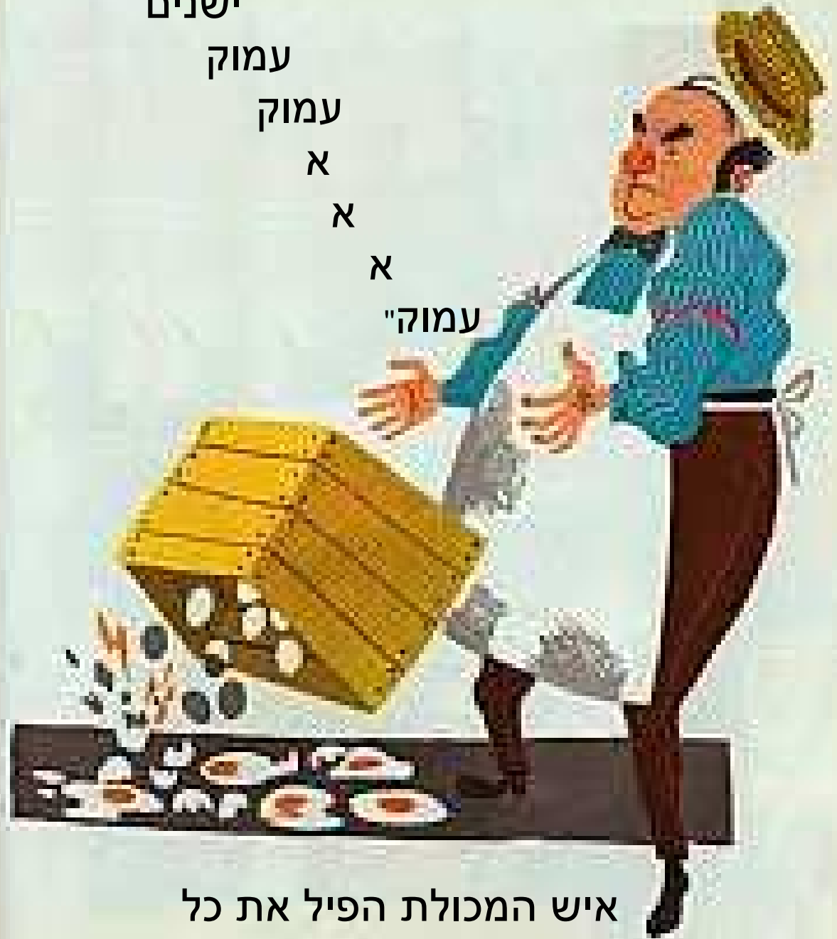
איש המכולת הפיל את כל הביצים שלו!