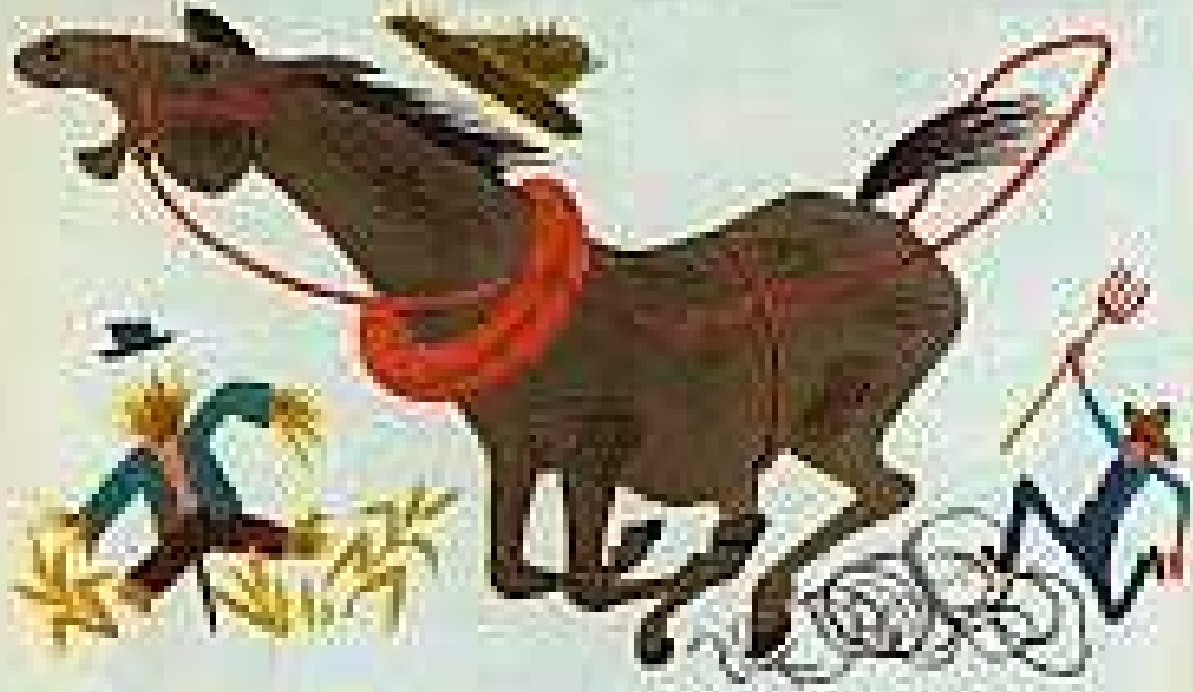
הסוסים של האיכר ברחו מאורווה.