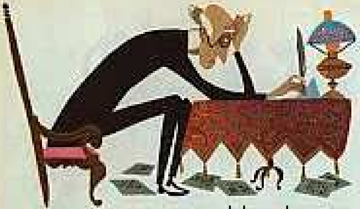
הכומר לא יכול לכתוב את הדרשה.