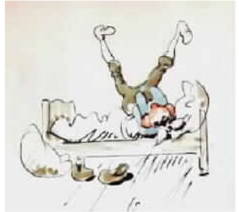
פריץ מנפנף ברגליו ובוכה מרות,