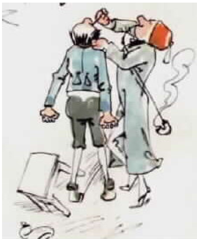
ופריץ קופץ מהכיסא בצעקה,