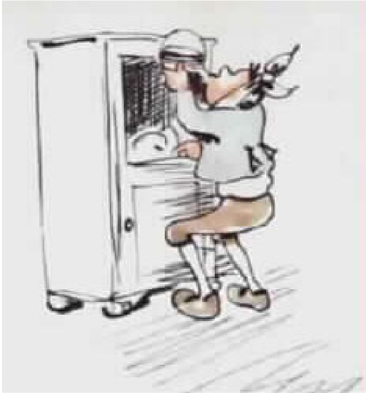
או כוסית של ייש בקור