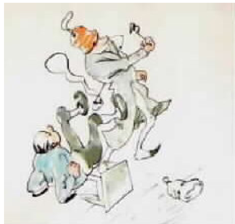
אך הרופא מתחיל במלאכה,