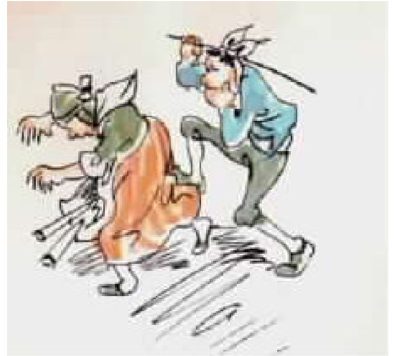
"לכי לכל הרוחות עם העצות!"