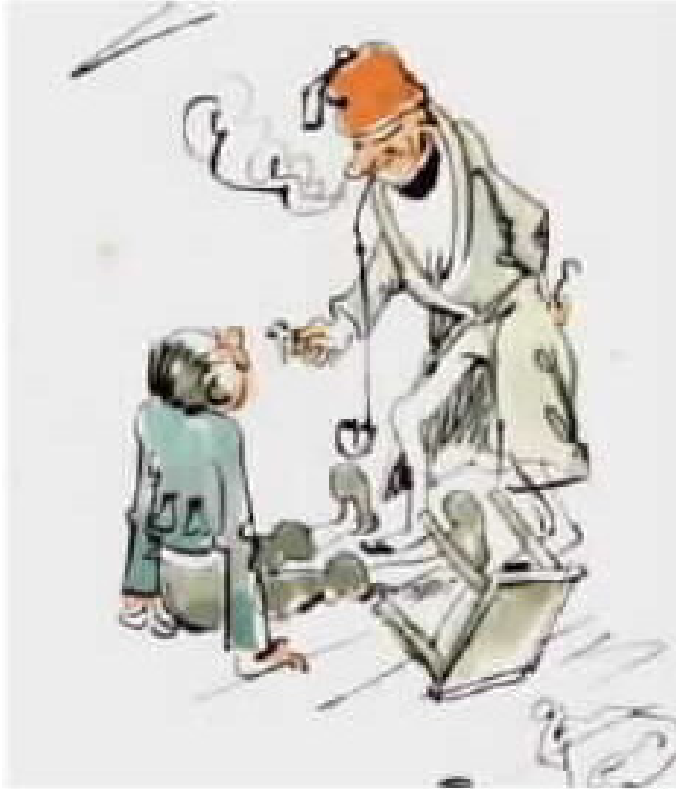
כך שוחרר פריץ מכאביו וצרה.