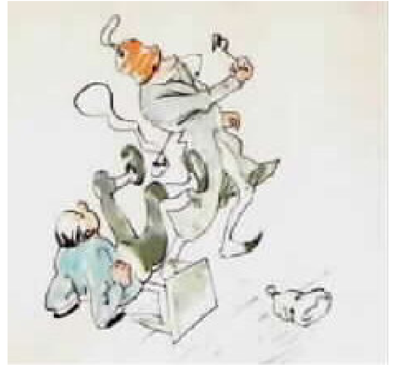
טרח... "הנה השן הזדונית, המכאיבה".