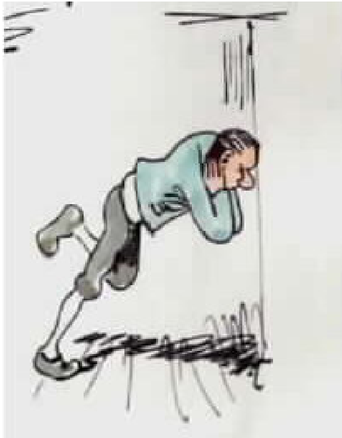
אולי חזק לקיר ללחוצו,