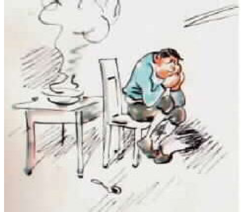
כך גם לפריץ שלנו קרה