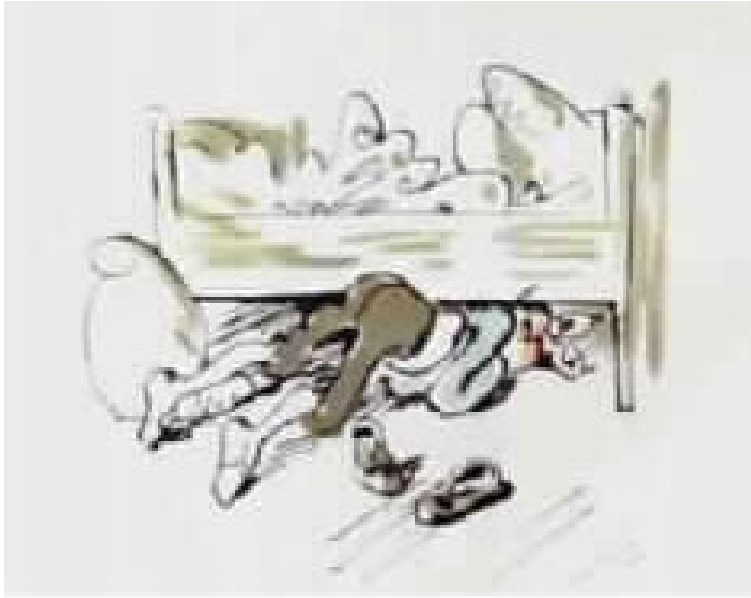
מתחת המיטה הוא נחבא לצד כריות