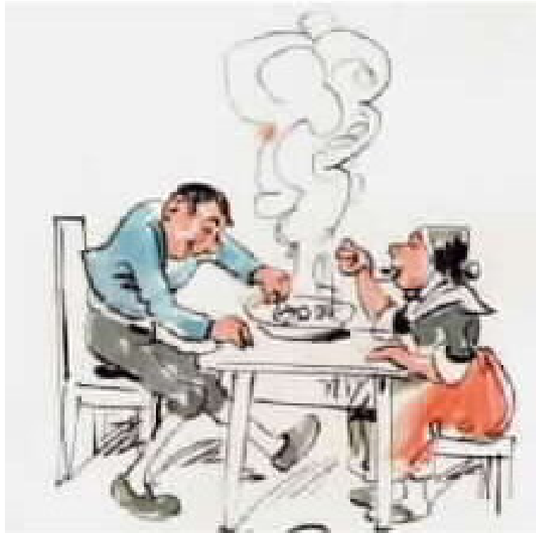
ופריץ שוב יכול להנות מהארוחתו.