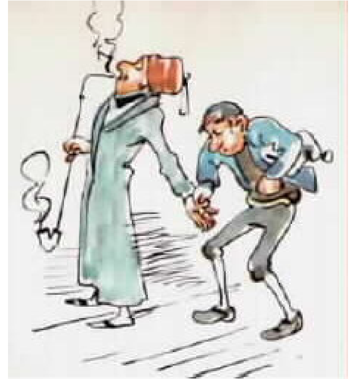
הרופא מקבל בכבוד רב את שכרו,