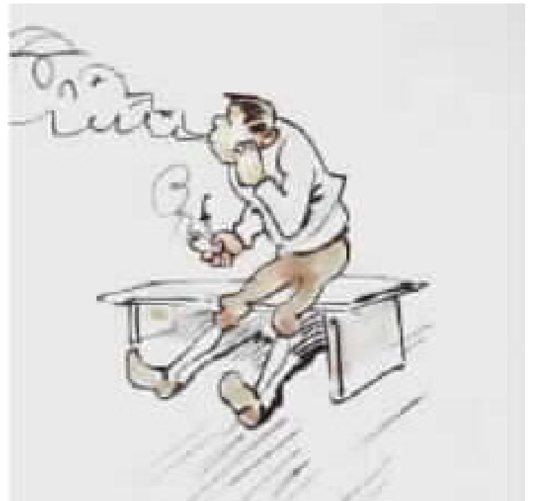
אומרים - אולי עשן יעזור,