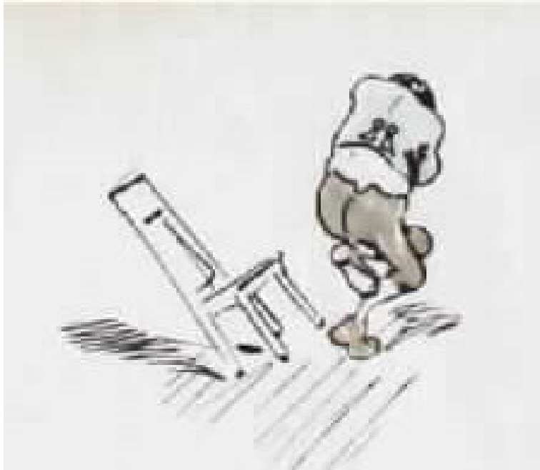
מרוב הכאב החזיק בלחי נפוחה