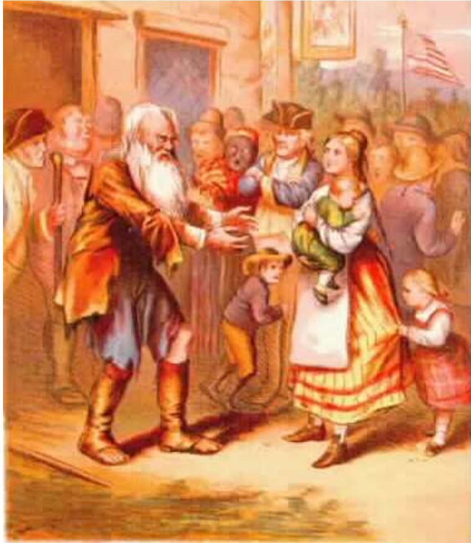
ואנשי המדינה הצעירה התייחסו בספקנות

אך אהבתו לסיפורים נשארה כפי שהייתה, והוא סיפר לעתים קרובות על משחק הכדורת ועל המשקה ועל האנשים המוזרים. רק שבינתיים התחוללה המהפכה האמריקאית,