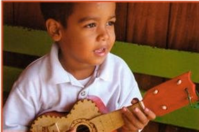
ומביעים הרגשות פנימיות.