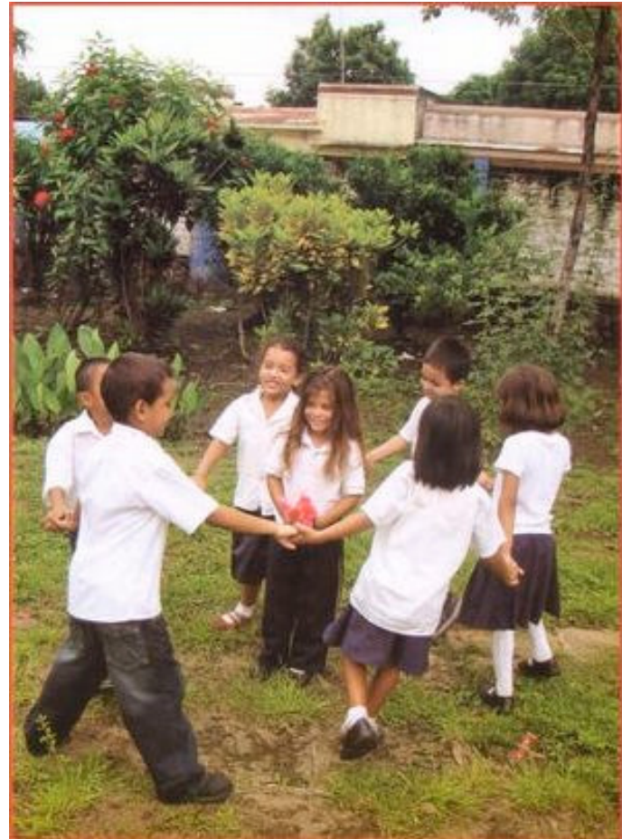
בשירת פינו אנו מתקרבים לאחרים