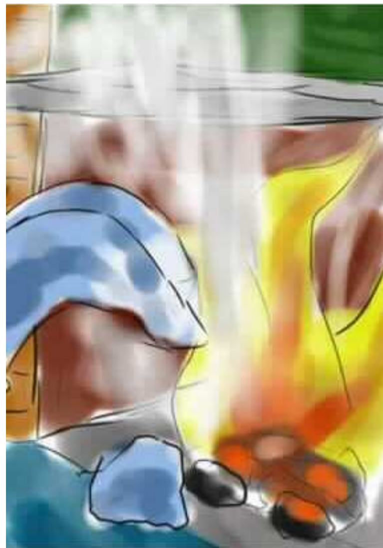
התחילו המים לכבות את האש.