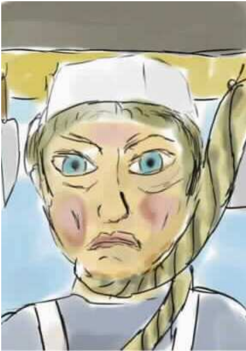
רץ החבל וכרך את עצמו על צווארו של השוחט.