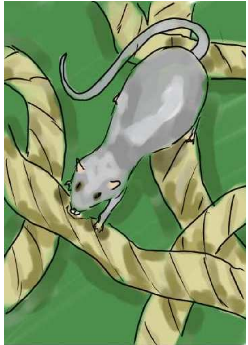
התחיל העכבר לנגוס בחבל.