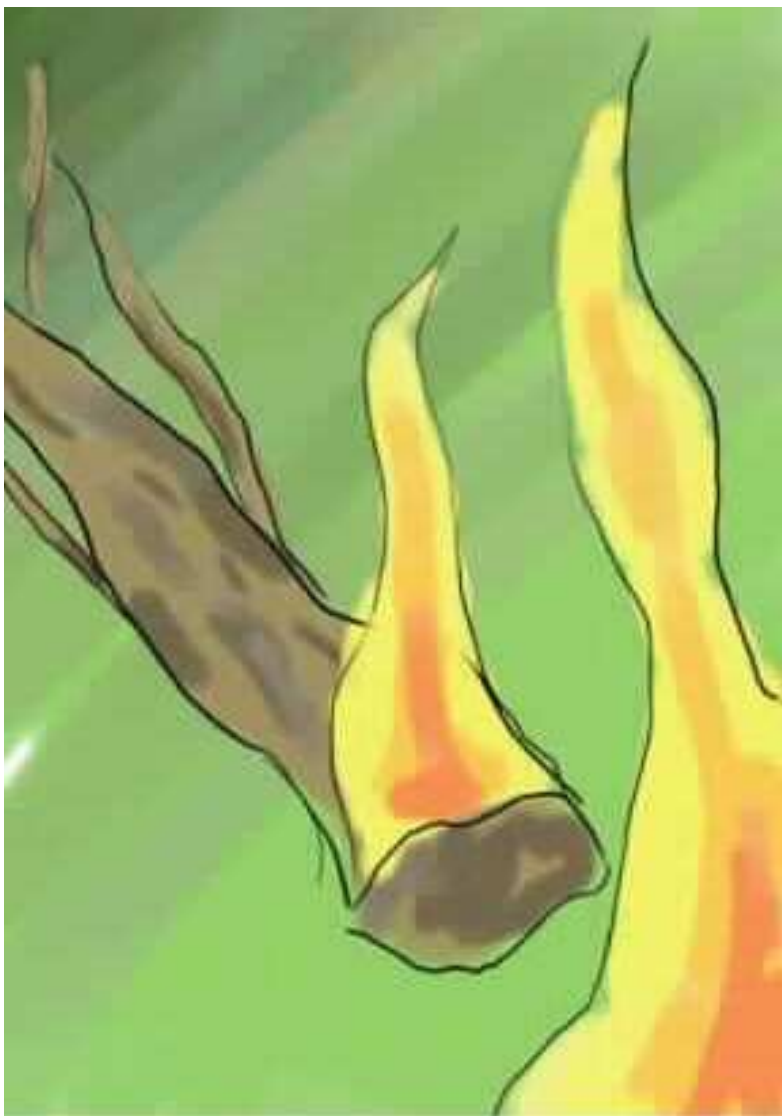
עלתה האש על מקל והתחילה להבעיר אותו.