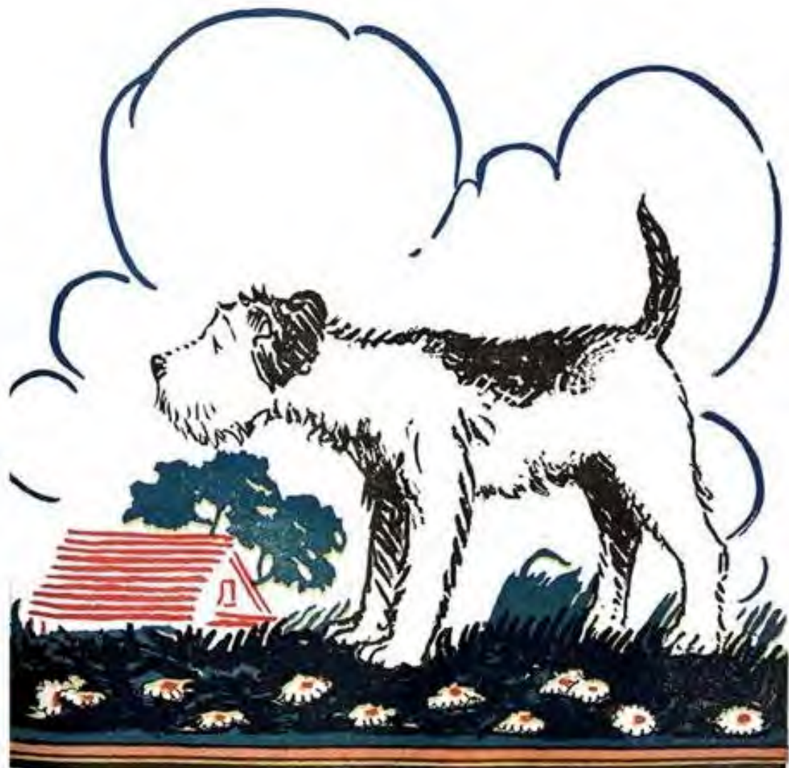
לבטי יש עגלה קטנה.