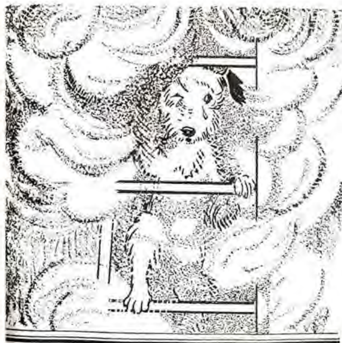
דמעות יצאו מעיני.