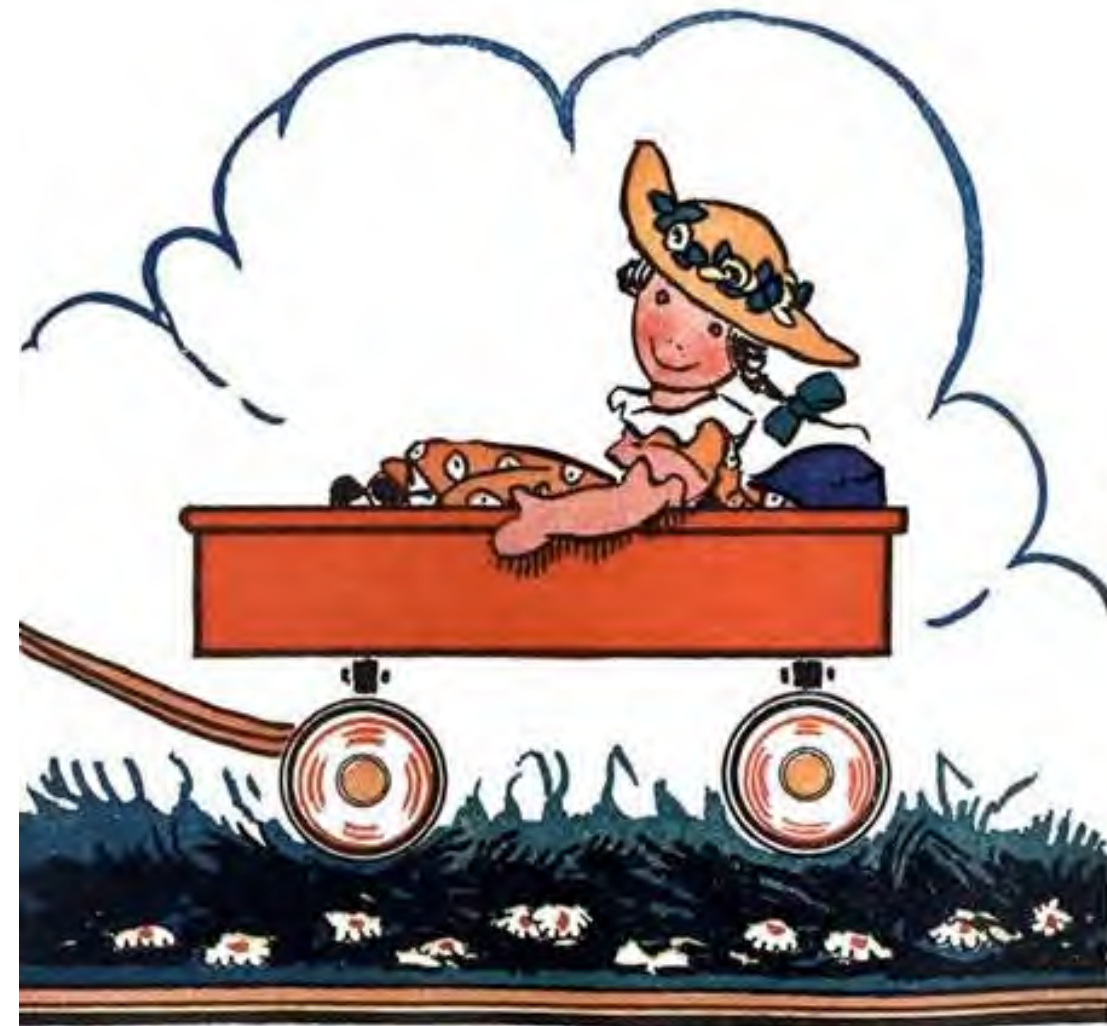
מטילדה נוסעת בה מדי בוקר.