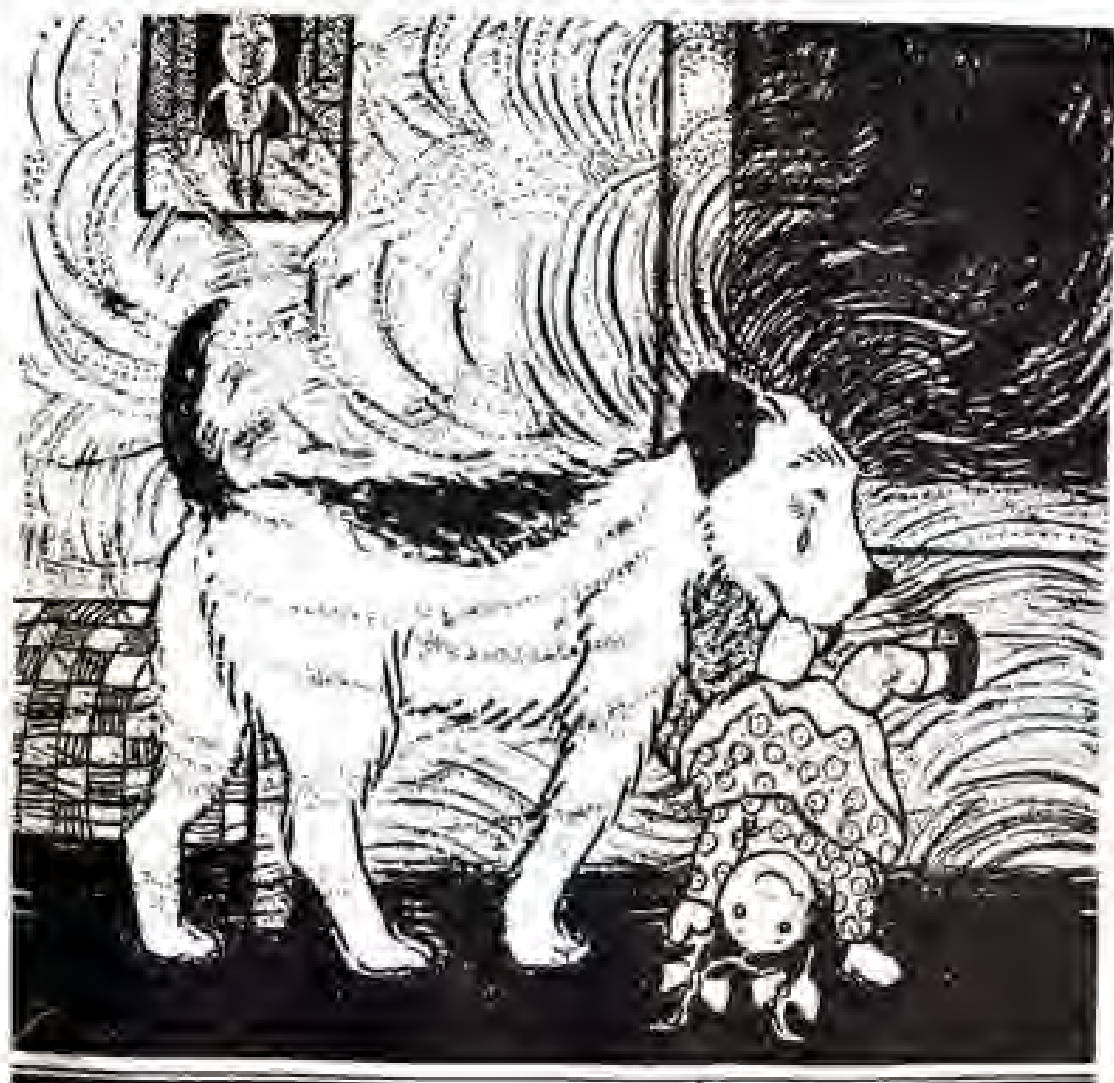
לקחתי מטילדה בשניי