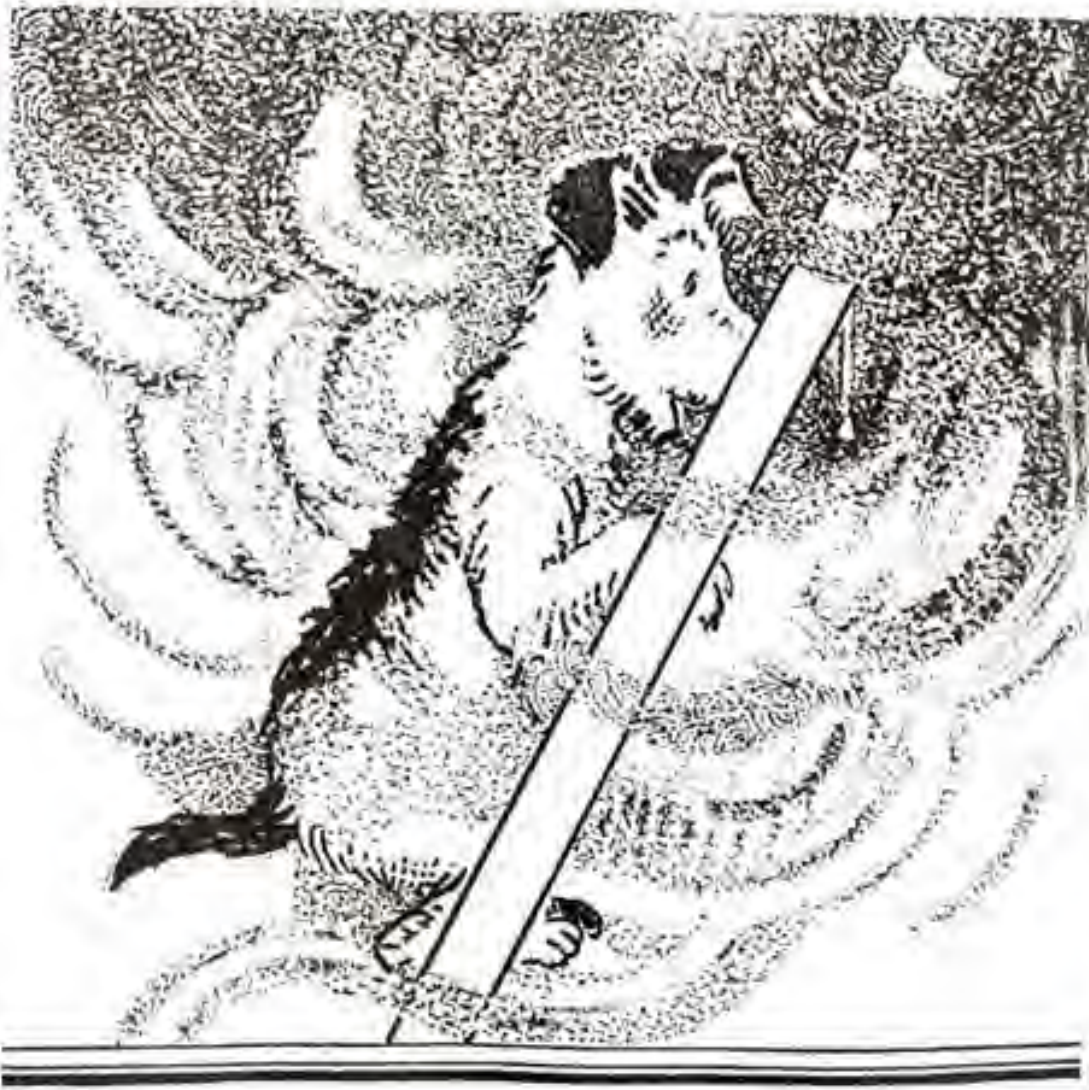
ניצוץ נפל כמעט על הראש שלי.