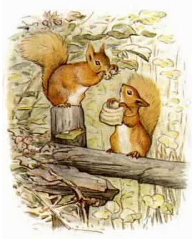
ערוך לפי המהדורה משנת 1903