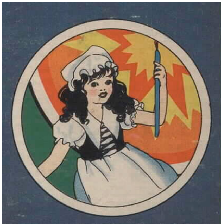
ויולט מור היגגינס (1886 – 1967)