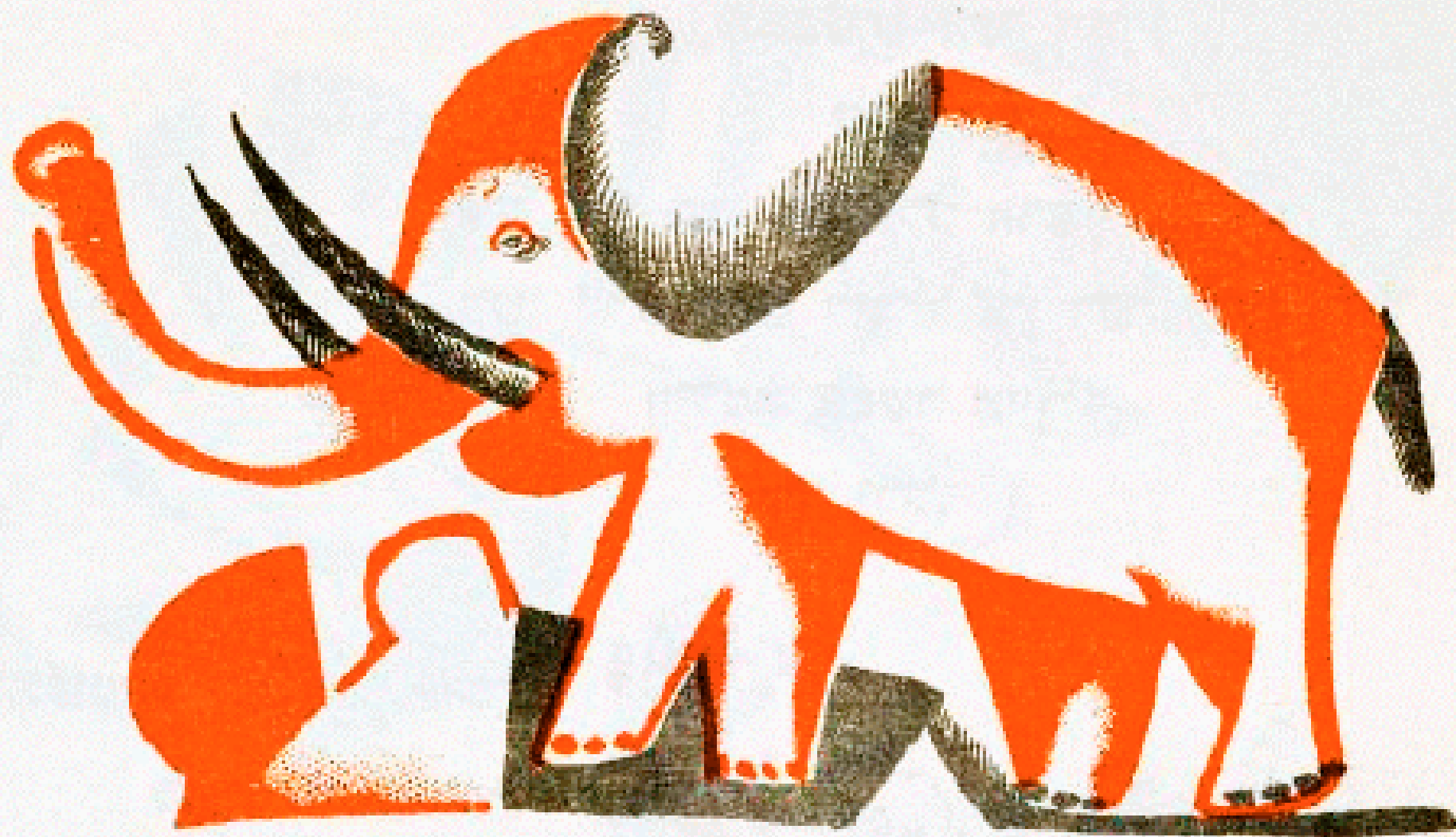
יצא מהיער פיל.