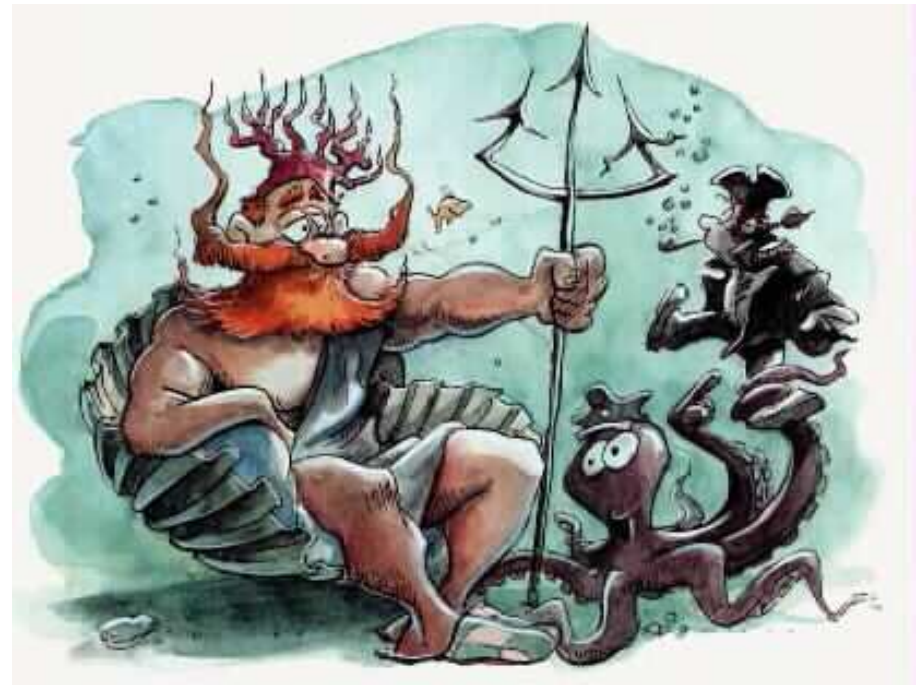
על קרקעית הים ישב מלך הים על כס מלכותי עשוי צדפים, ועל ראשו חבש כתר אלמוגים.