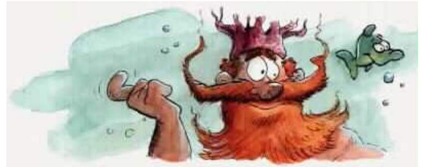
הוא הביט עלי בעין קפדנית וקרא לבתו.