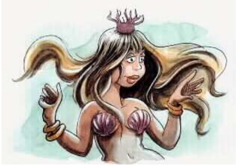
הבת הייתה יפה מאוד בגופה העליון,