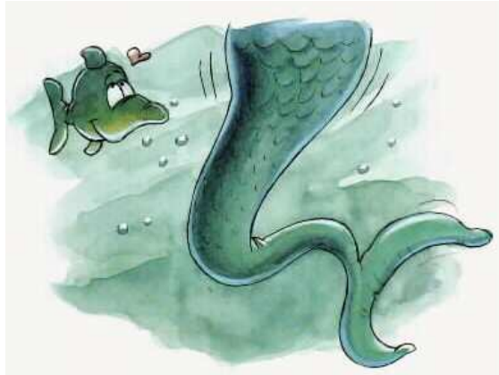
אך בחלקה התחתון לא כל כך מצאה חן בעיני.