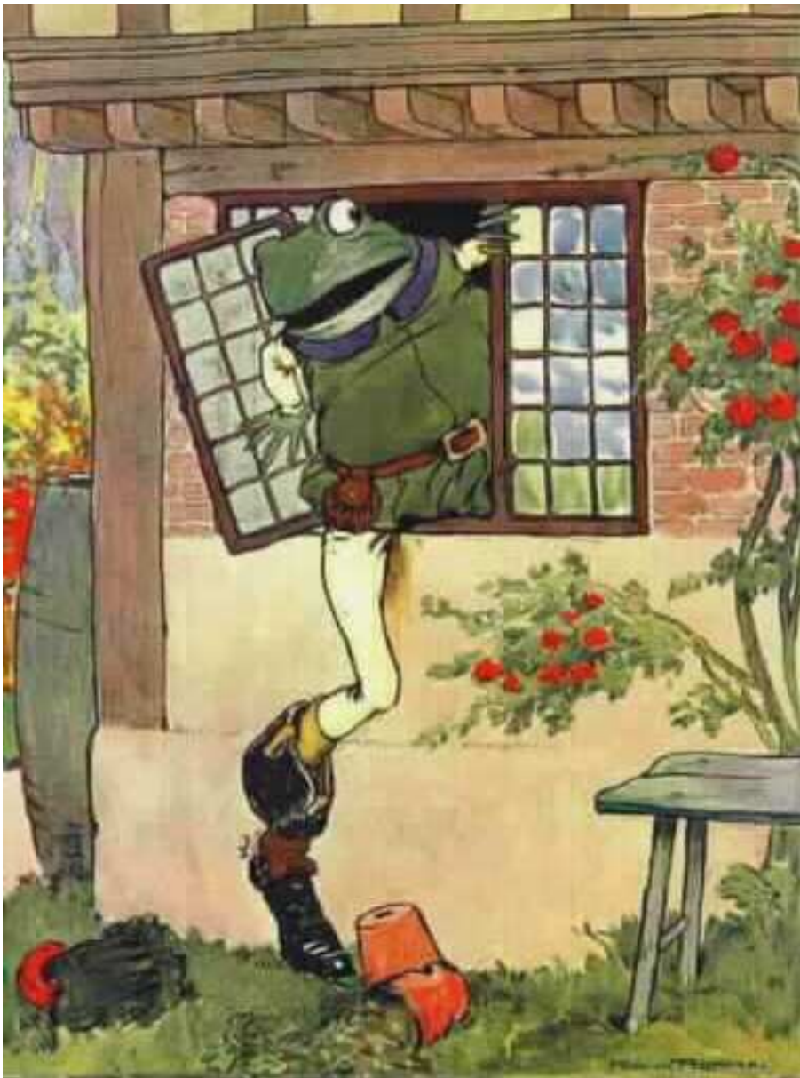
הצפרדע קפץ בבהלה ומיד דרך החלון יצא.