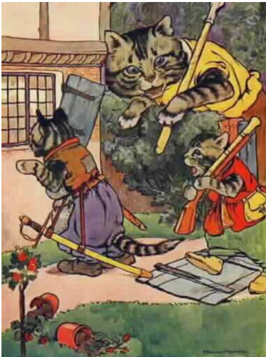
וכך כשהם בשמחה מבליים ליד הבית הופיעו חתולים