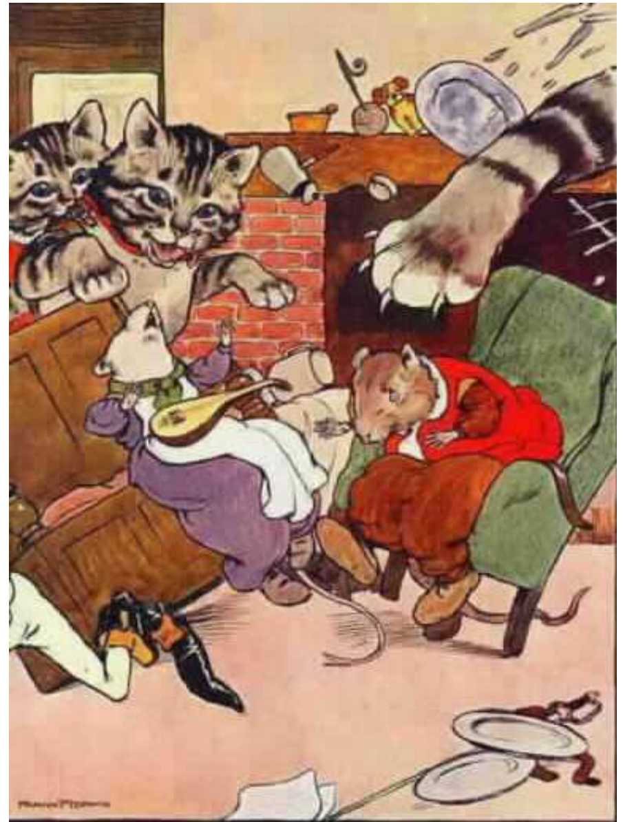
אחד תפס את החולדה בצוואר שני האחרים תפסו את העכבר.