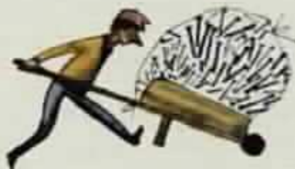
מסמרים גדולים לתקרה ודקים לנגרות, מאה פחים של צבעים שונים, ירוק, צהוב, אדום, כחול, כתום ושחור,