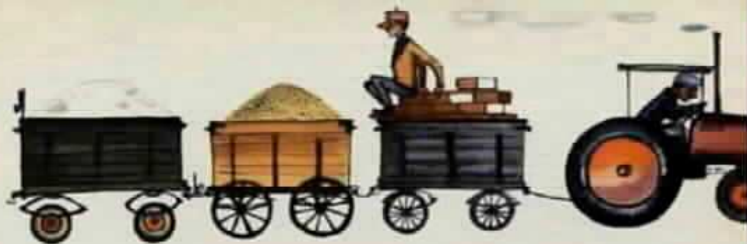
הבאתי עוד סיד, טיח, חול, ומרצפות,