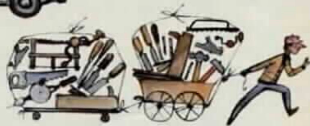
אחר כך הבאתי כלים: מקצועים, מחליקים, משורים, אזמילים, מקדחות, מברגים, פטישים, גרזנים ומקדחים