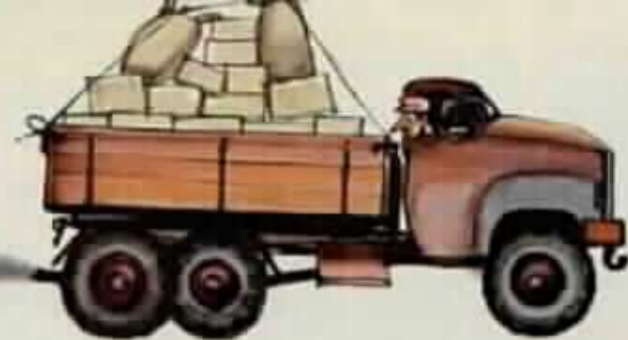
תחילה הבאתי אבן לבנים וחצץ ליסודות, וגם רעפים אדומים לגג,