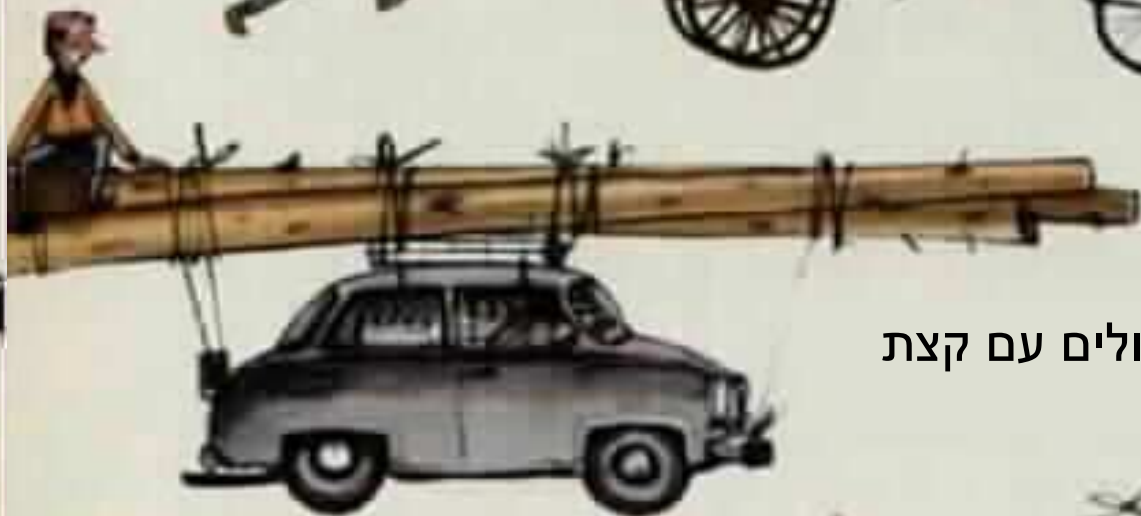
ובולי עץ צהוב עגולים עם קצת זפת לקירות.