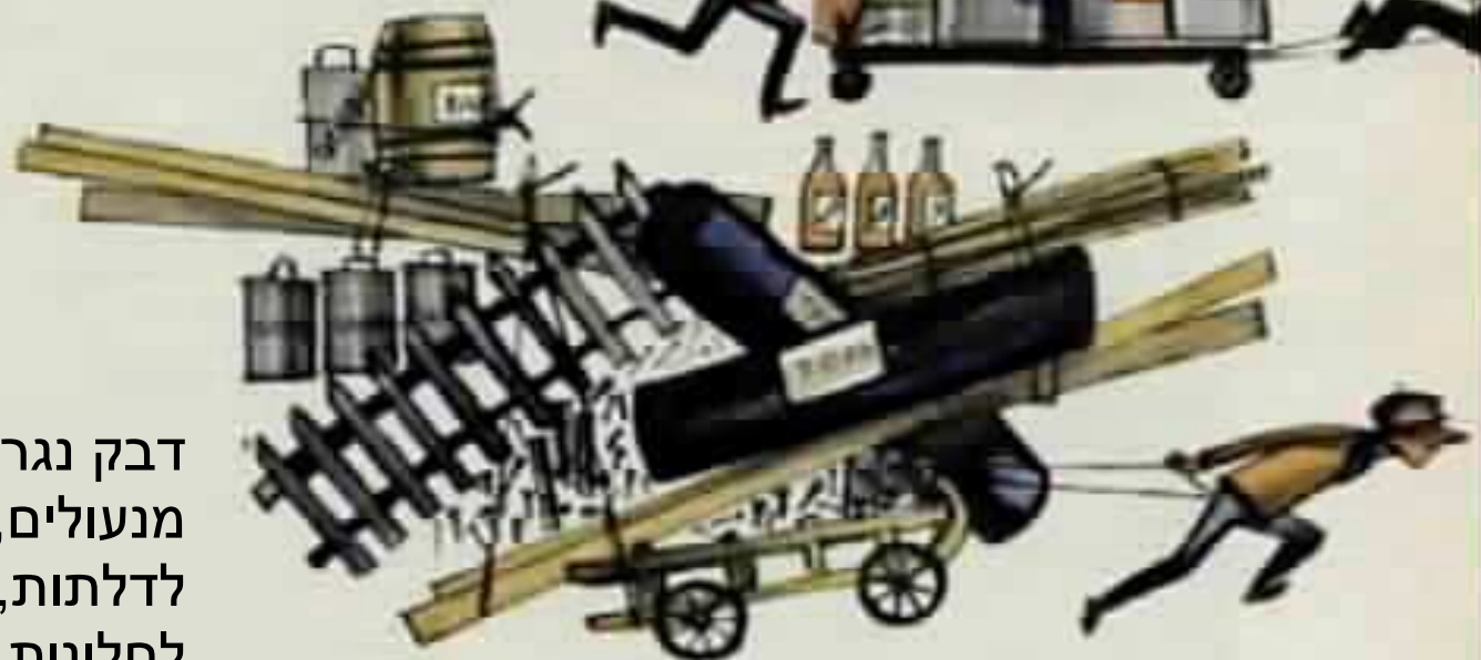
דבק נגרים, לכה, מנעולים, ווים, ידיות לדלתות, בריחים לחלונות, קרשים, מהדקים, ברגי עץ, מוטות גדר, ניר זפת, חבל פשתן, מרק.