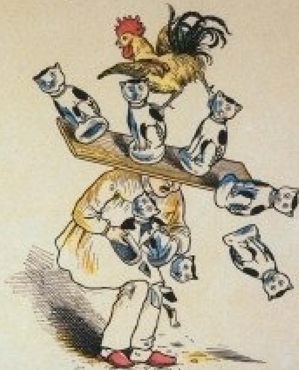
כל הסחורה מתמוטטת ונשברת.