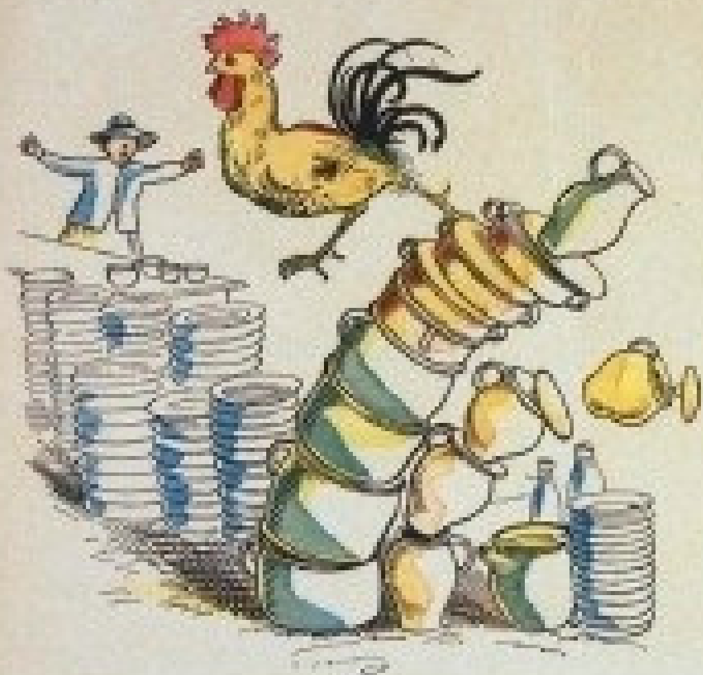
התרנגול ממשיך במלאכת ההרס.