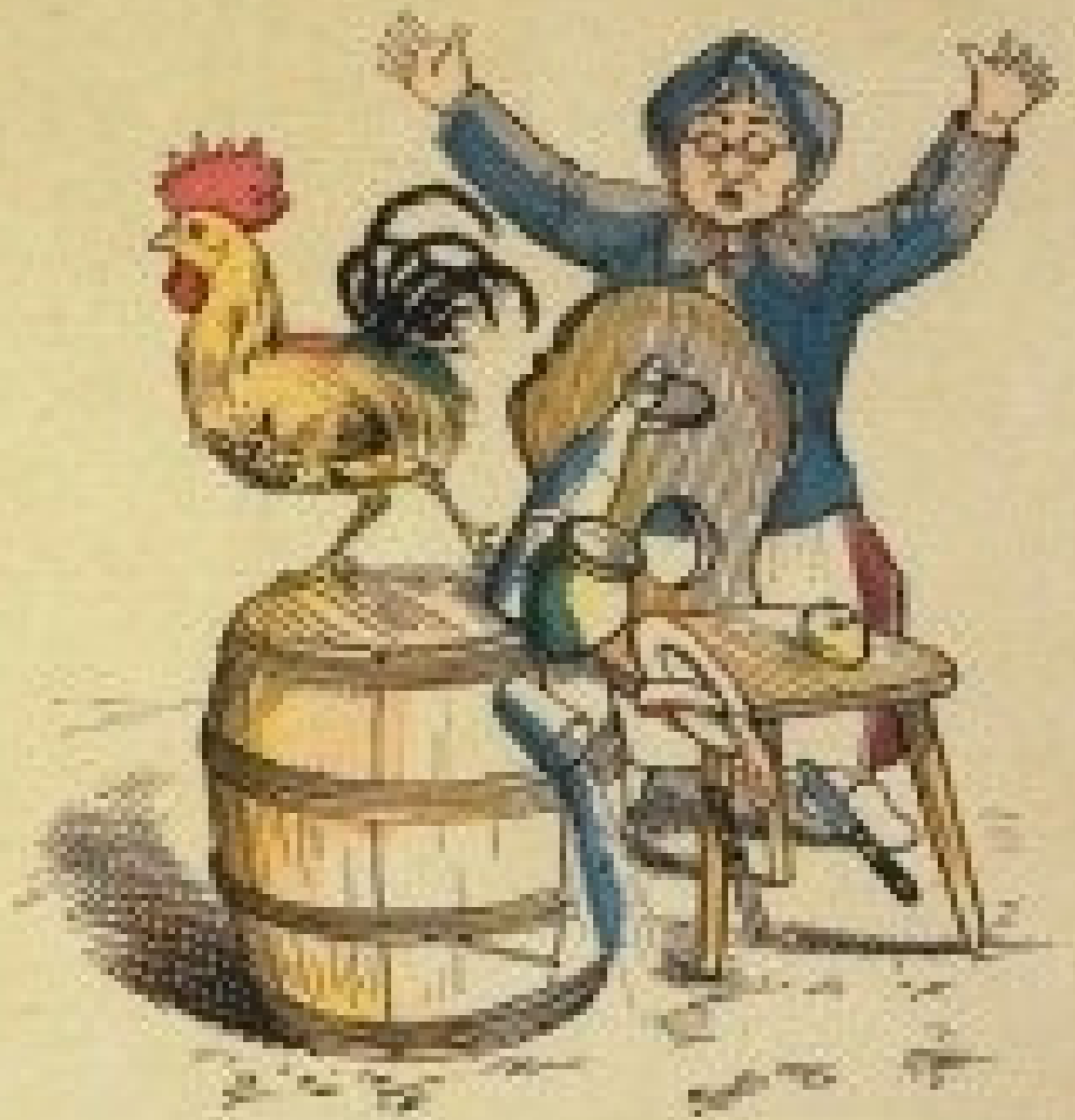
התרנגול בינתיים הופך ושובר קנקני יין