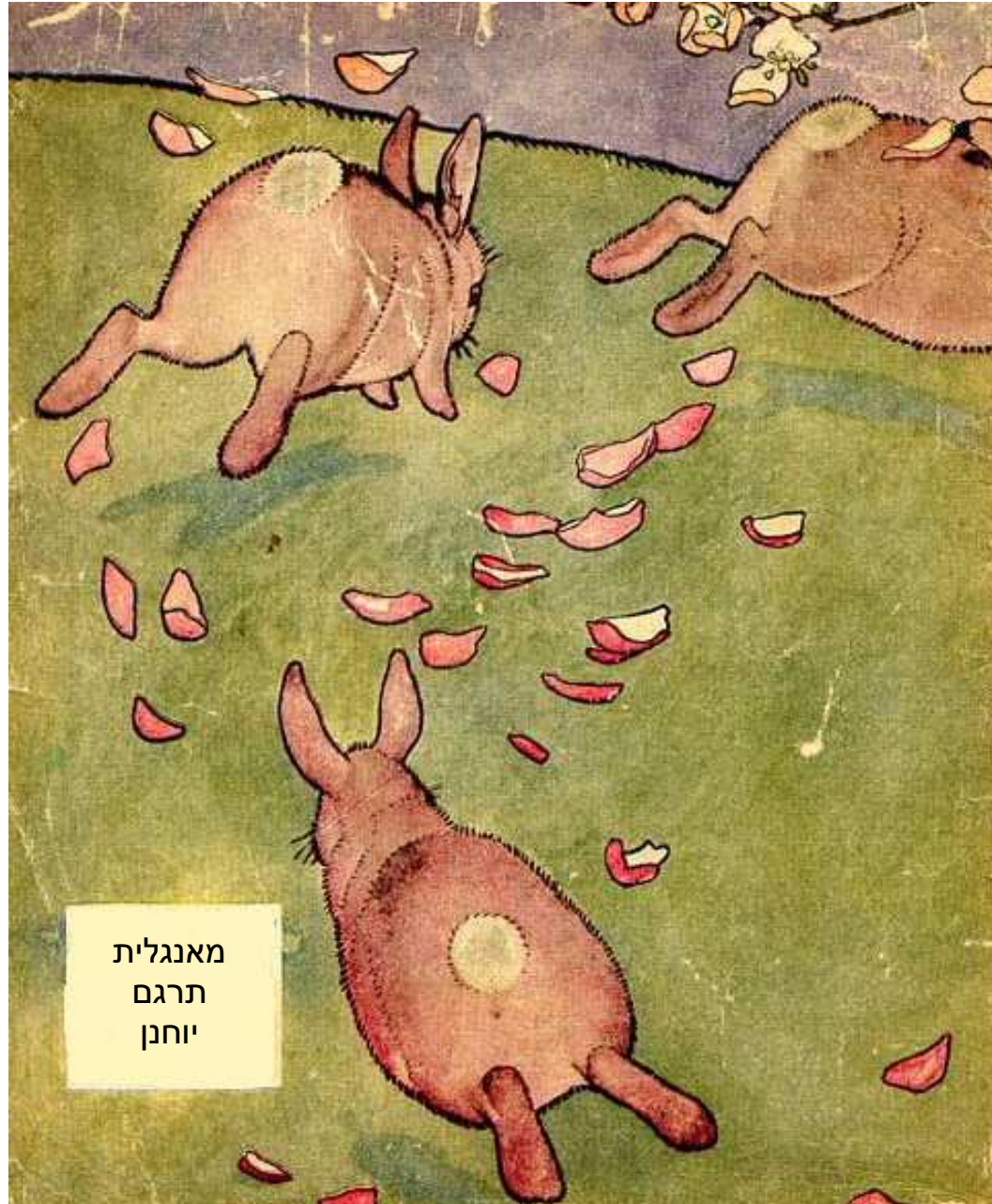
מאנגלית תרגם יוחנן