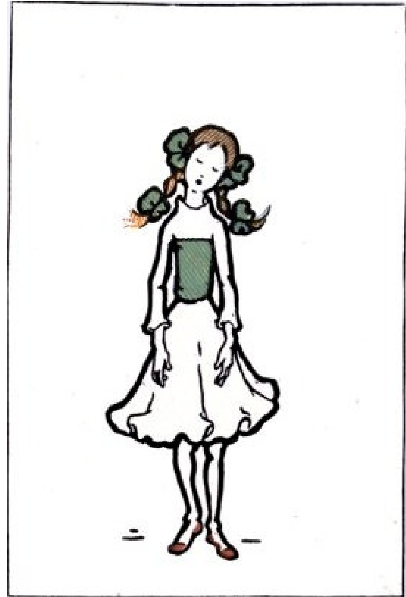
אבל היא נעשתה כל פעם חיוורת יותר ויותר.