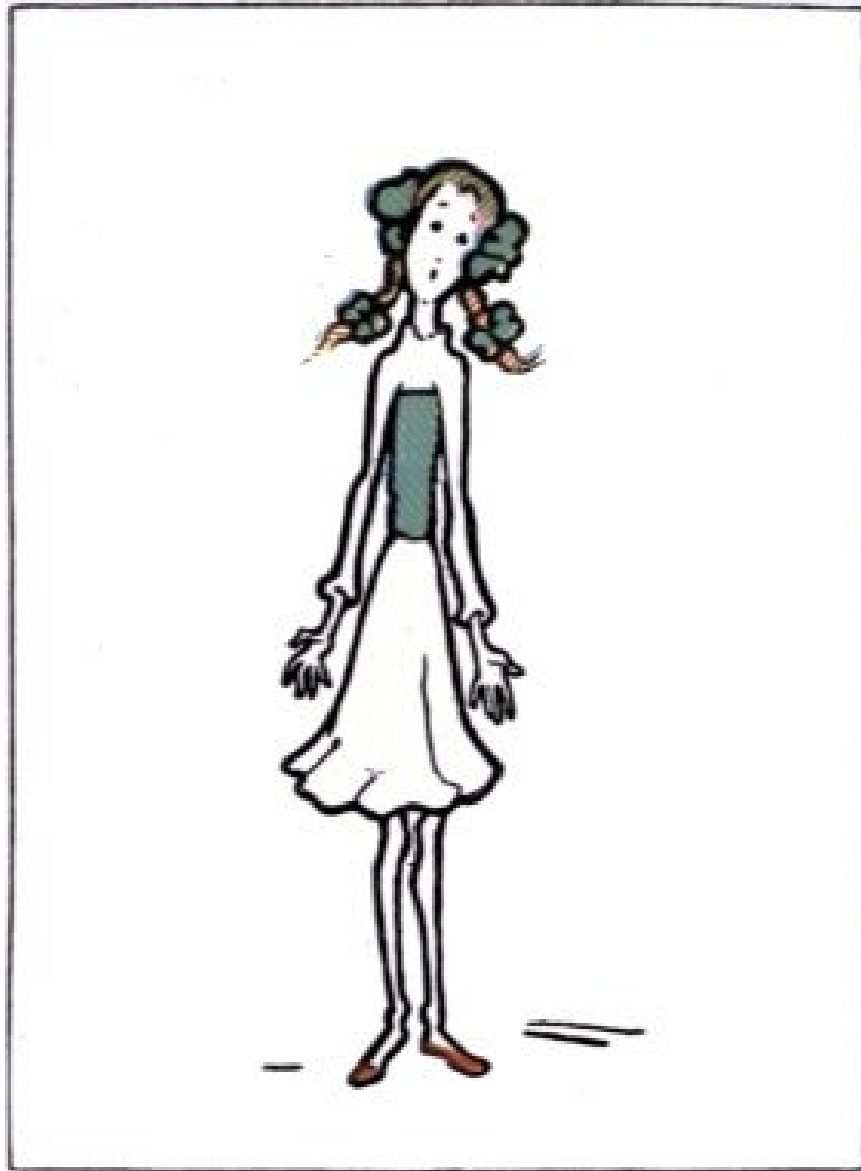
ורזה יותר ויותר.