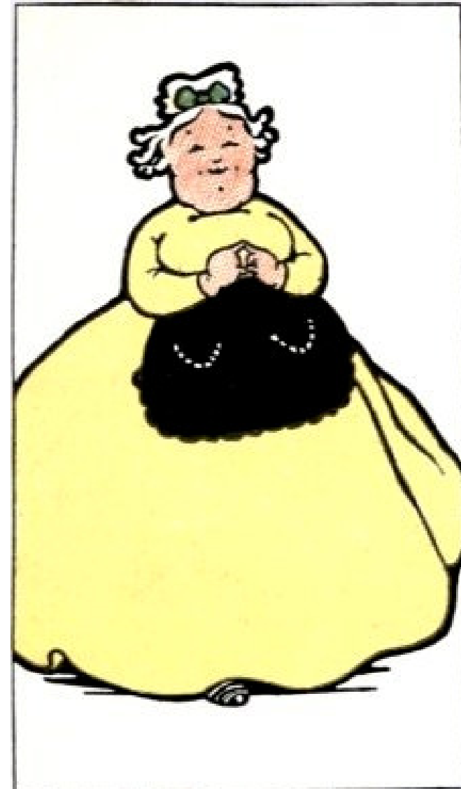
זו דודה דוסי.