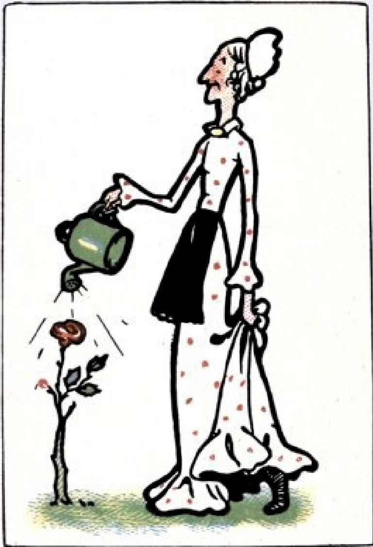
זו דודה פוסי.