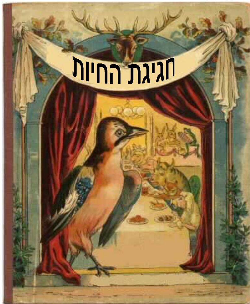
1891 "תתקרבו-נא" אומר התור