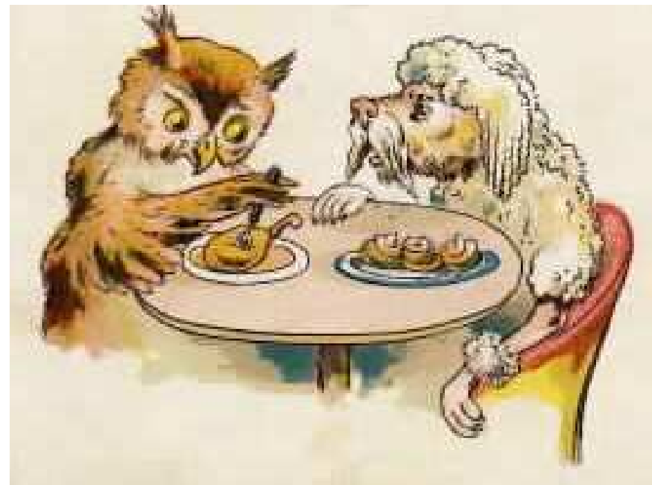
"שוק כבש" עונה האוח "לא! כרוכית" אומר הכלב.