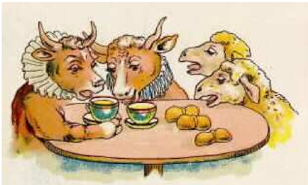
"מרק בשר" גועות הפרות "לחמניות" פועים הכבשים