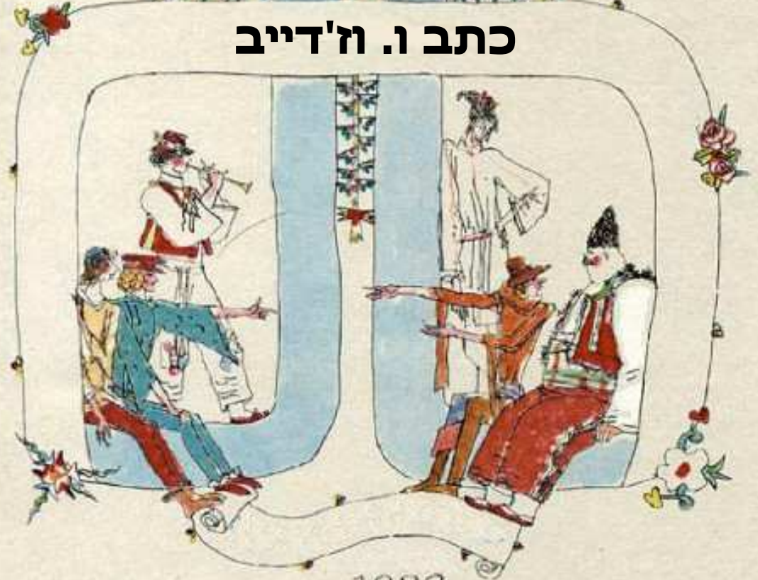
כתב ו. וז'דייב