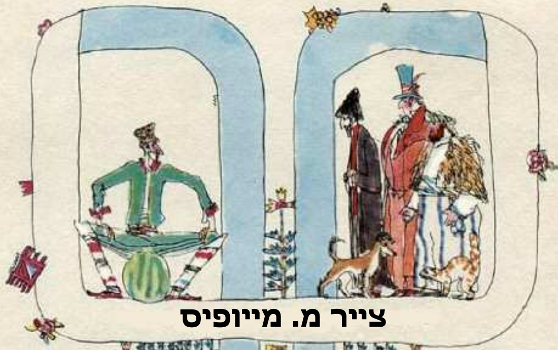
צייר מ. מייופיס