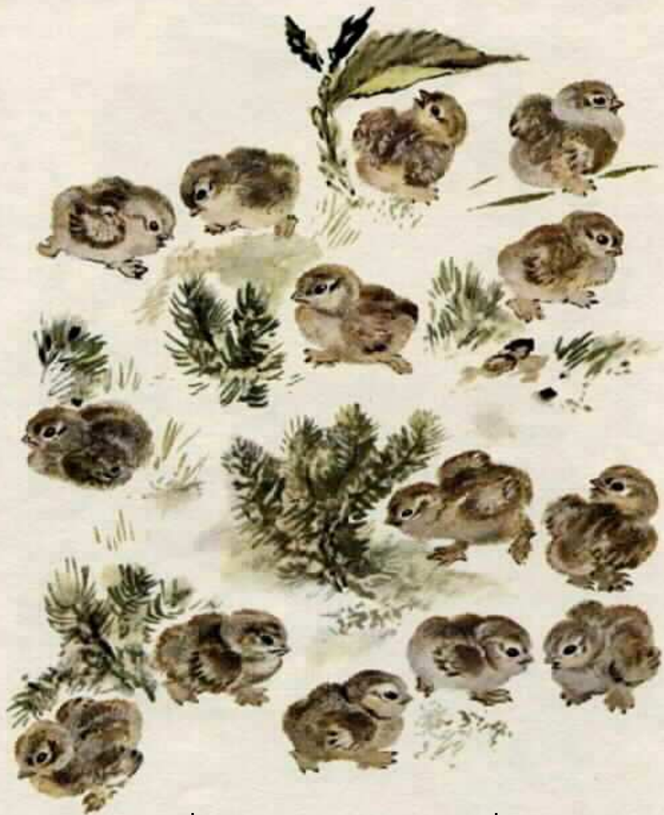
האפרוחים יוצאים, כל אחד ממקום אחר. מי מתחת לשיח, מי מתחת לאשוח, מי מעשב גבוה או משקע באדמה.